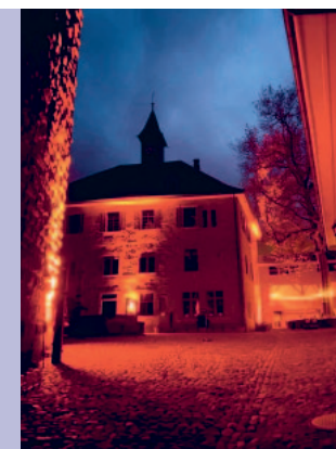
Die leuchtende Burg am Räbenfest