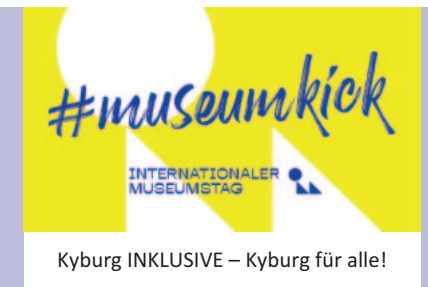
Logo Internationaler Museumstag