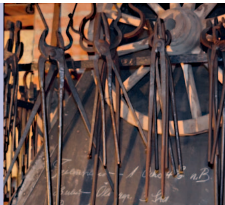
Werkzeuge aus einer Elgger Werkstatt im Heimatmuseum