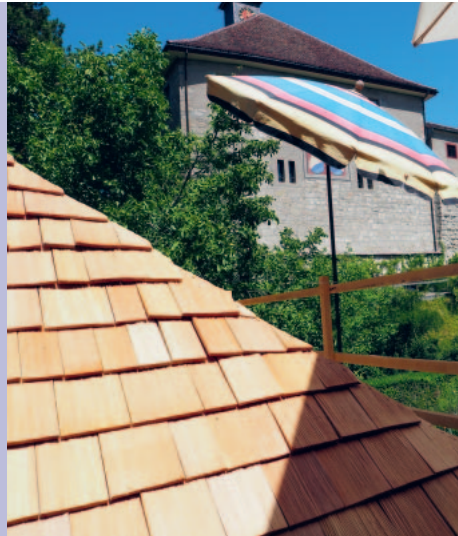
Das neue Schindeldach