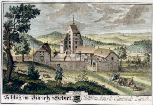
David Herrliberger: Schloss Elgg, um 1754 (Sammlung Winterthur)

Vom drohenden Wetterumsturz, der sich mit heftigen Sturmböen ankündigte, zur Eile angetrieben, ging's durch die Hintergasse, vorbei am Obertor zum ausserhalb des Städtlis