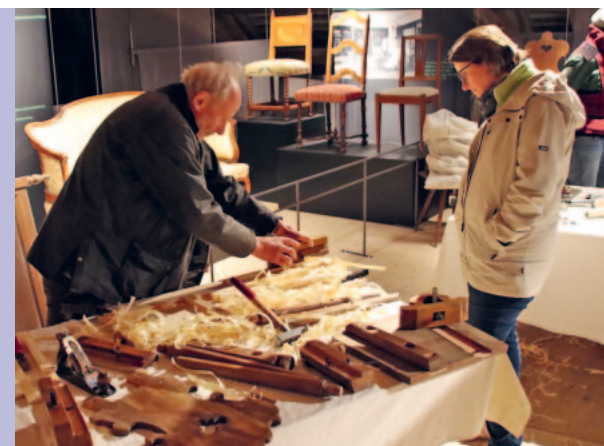
Hobelarbeit zum Miterleben