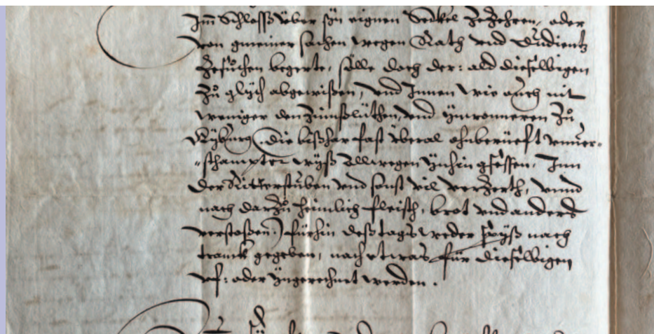
StAZH B VII 21.87 Nr. 78: Ausschnitt aus dem Reformprojekt des Grossen Brauchs von 1628, wo die unverschämten Einwohner von Kyburg erwähnt sind.

bißhar fast vberal ohnberüeft vnverschämpter wyß [unverschämterweise] Allwegen ynhin gessen, Inn der Ritterstuben vnd sonst vil verzerth, vnnd nach darzu heimlich Fleisch, brot vnd anders verstoßen [d.h. gestohlen] 25 26