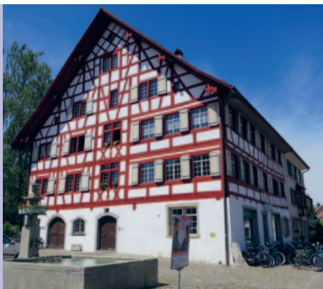
Das ehemalige Gasthaus «Meise»