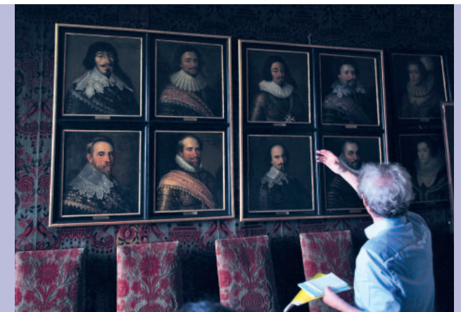
Porträts von Fürsten und Heerführern des 17. Jahrhunderts