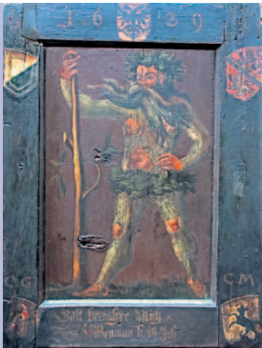
Das alte Wirtshausschild vom «Wilden Mann» in Winterthur aus dem Jahr 1629 hat den Weg auf die Kyburg gefunden und hängt im Estrich des Ritterhauses.

Am großen Brauch mußte mann haben 1 Rind, 2 Schweine, 3 Kälber, 2 Schaaff, 2 Gizli, Wildprätt, 9 Gänss, 9 Capunen, 2 Welschhanen, 11 Haasen, 3 Totzet [Dutzend] Rint-schnäpff [wohl eine Schnepfenart], 2 Totzet Rebvögel, 18 Totzet Leerchen, 8 Güggel, 10 Pasteten, Fisch und Würst. 6