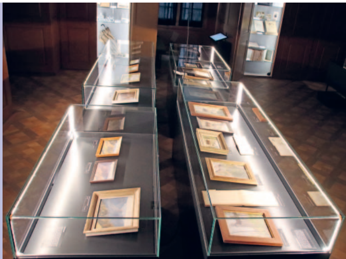
Blick in die Schaeppi-Ausstellung in der Landvogtstube

Am Sonntag, 18. Mai beteiligte sich auch das Museum Schloss Kyburg am Internationalen Museumstag mit dem Thema «Vielfalt im Museum». Auf der Kyburg stand der Tag unter dem Motto «Kyburg INKLUSIVE – Kyburg für alle!». Führungen fanden statt in einfacher Sprache, für Sehbeeinträchtigte, für Gehörlose mit Gebärdendolmetscherin sowie für BesucherInnen mit eingeschränkter Mobilität. Zudem gab es im Viertelstundentakt die Möglichkeit, «Kyburg mit allen Sinnen» zu erfahren und selbst praktisch tätig zu werden, angeleitet von den Cicerones (Wasserschöpfen am Ziehbrunnen, Kleider und Rüstung anprobieren, Zielwerfen, Gewürz-Me-