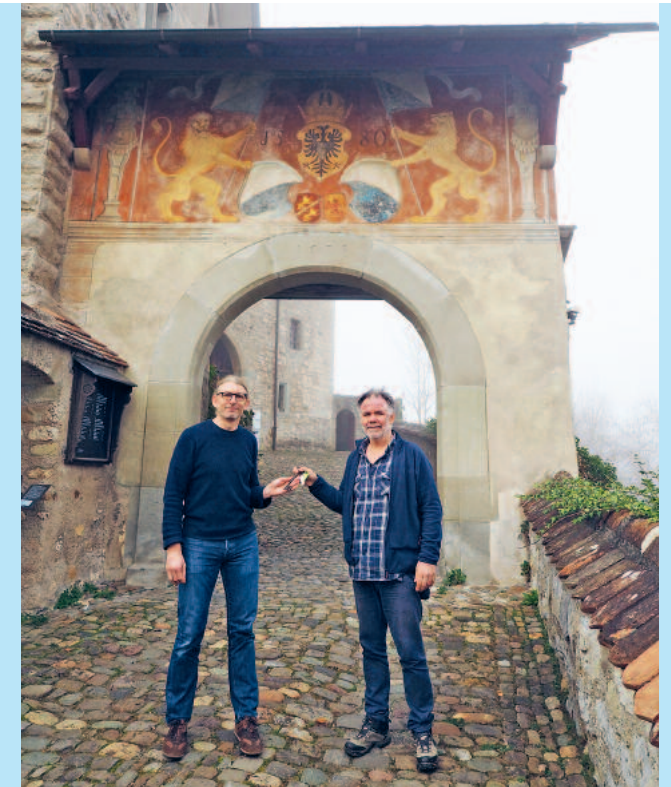
Schlüsselübergabe an den neuen Museumsleiter