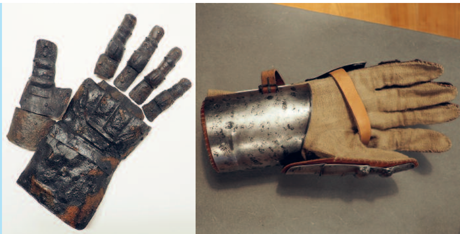
Panzerhandschuh aus dem 14. Jahrhundert, in der ehemaligen Vorburg ausgegraben und die Rekonstruktion zum Anprobieren

Auch 2024 konnten wir in den Schulferien (Frühling, Sommer, Herbst) in Kooperation mit verschiedenen Partnerorganisationen Ferienprogramme anbieten. Die spielerischen Kinderführungen mit praktischen Elementen rund um die Geschichte von «Johann und Johanna» samt