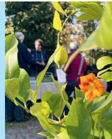
Saisonausklang mit Suppe im herbstlichen Schlossgarten