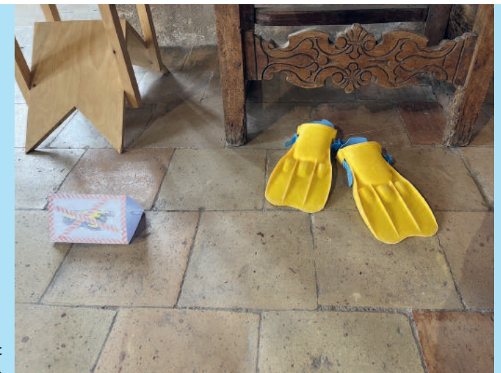
«Die Prinzessin mit den Entenfüssen»

Das Angebot der öffentlichen Führungen stiess 2024 auf grossen Anklang, insbesondere die Familienführung. Die Übersichtsführung «Mauern der Macht» war jeweils auf den ersten Sonntag im Monat angesetzt (am 7.4., 5.5., 7.7., 4.8. und 6.10.), die Familienführung «Ritterburg – Landvogtschloss – Burgmuseum» fand immer am dritten Sonntag statt (am 21.4., 19.5., 16.6., 21.7., 18.8., 15.9. und 20.10.). Um den grossen Andrang von bis zu 70 interessierten kleinen und grossen Gästen zu bewältigen, wurden einige der Führungen ad hoc in leicht verkürzter Form zweimal hintereinander angeboten.