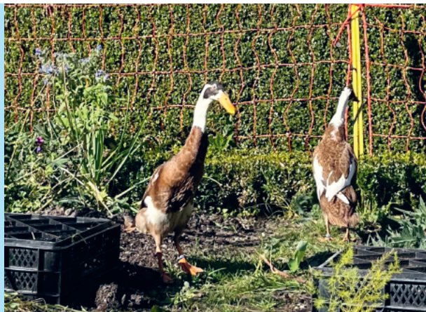
Die Laufenten «Krethi und Plethi» im Schlossgarten