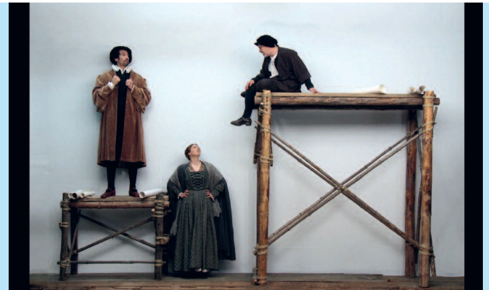
Szene aus der audiovisuellen Ausstellung «Zunftstadt Zürich»

Wir liessen die Abfolge der historischen, meistens aus nicht mehr existierenden zürcherischen Häusern stammenden Interieurs, mit Ausnahme des prachtvollen Zimmers aus dem Werdmüllerschen Seidenhof, beiseite und warfen zum Schluss unseres Museumsrundgangs im ersten Stockwerk noch einen Blick auf die beiden grossen Kachelöfen, die 1698 als Geschenk der Stadt Winterthur in das damals neu gebaute Zürcher Rathaus gelangten. Die Kacheln der von Heinrich Pfau geschaffenen Öfen weisen durchdachte Ikonographien zur eidgenössischen und zürcherischen Vergangenheit auf, und unter den Zürcher Bildern sticht die Darstellung der Kyburg besonders hervor. Die Wappen der äusseren Vogteien Kyburg, Grüningen, Greifensee und Regensberg sowie die Devise «DITANT ET DECORANT.