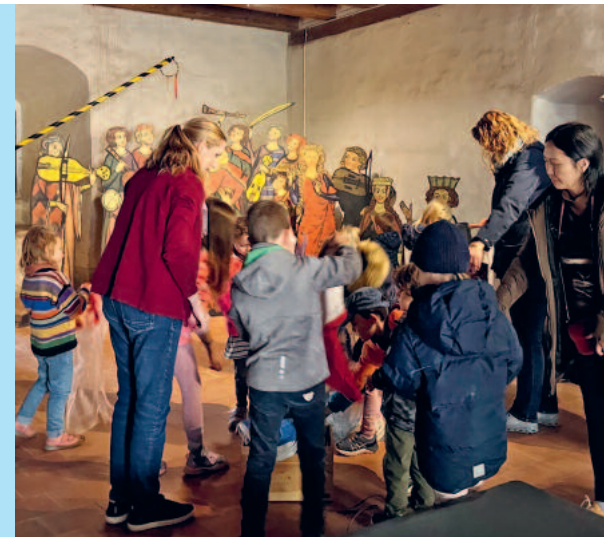
Tanz mit beim Ritterfest