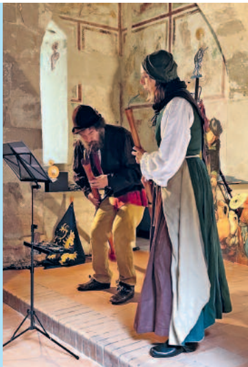
Die Kyburg spielt auf

Am letzten Saisontag, dem 31. Oktober, erkundeten die Gäste auf dem Familien-Rundgang «Durch die schaurig dunkle Burg» beim Schein der Taschenlampen mit geschärften Sinnen die Burg und ihre Umgebung. Passend zu Halloween gab es spannende und unheimliche Geschichten. Und bei einem Glas Glühmost klang der rege Besuchte, stimmungsvolle Anlass in gemütlicher Runde aus.