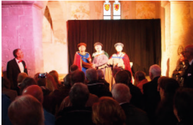
Der Bischof schmiedet mit den Grafen Heiratspläne.