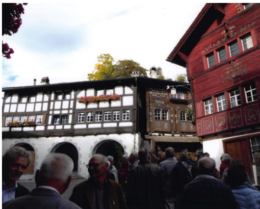
Die Reisegruppe im Städtli.