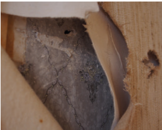
Entdeckt: Preisgünstige Tapete mit Blumenmuster, datiert auf Anfang 20. Jahrhundert in der Gerichtsstube des Ritterhauses.