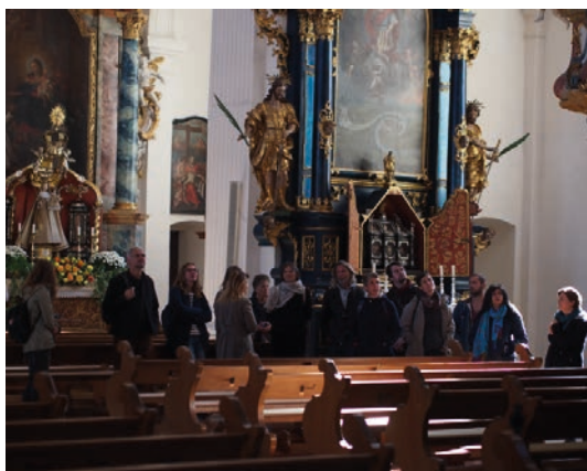
Das Team in der Klosterkirche Rheinau.

An Veranstaltungen sind zuerst die 10 Trauungen des Zivilstandsamts Illnau-Effretikon zu nennen, die im Festsaal durchgeführt werden konnten. Auch war die Kyburg wieder präsent in Film und Fernsehen, z.B. in «Zwinglis Erbe» oder in der 3sat-Reihe «Schlösser und Burgen der Schweiz». Zweimal wählte der SRF die Kyburg als Kulisse für Aschenput- telzene, für «SRF bi de Lüt» im Fürstentum Liechtenstein und «Klingende Weihnach- ten» am Heiligabend.