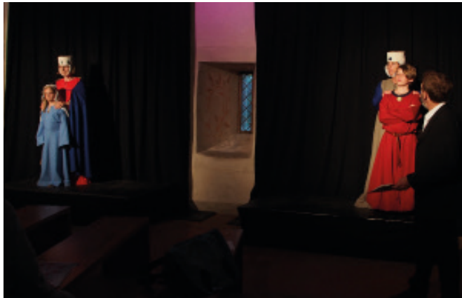
Die Mütter sind wenig begeistert.