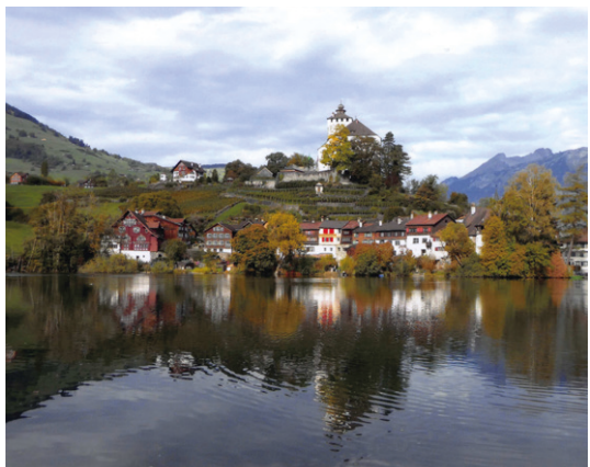
Werdenbergsee mit Städtli und Schloss.