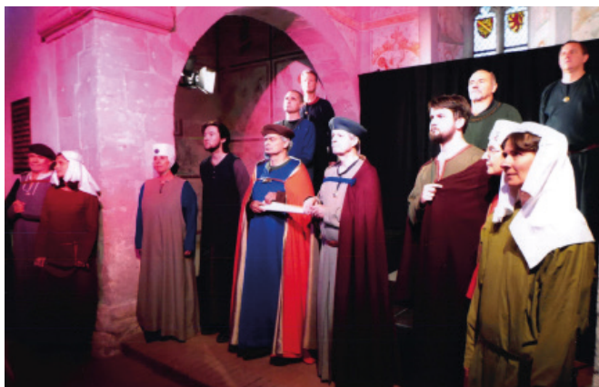
Feierlich wird die Verlobung mit Zeugen vertraglich geregelt.