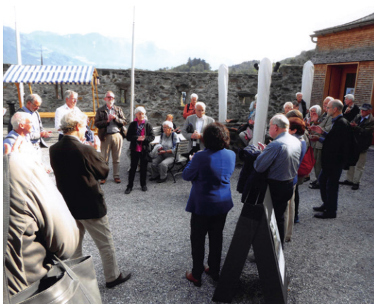
Die Reisegruppe vor dem Schloss.

Dank der sparsamen Ausstattung der Ausstellungsräume kommen die alten Strukturen im Inneren der Burg schön zur Geltung. Eine originelle Installation im Kellergeschoss präsentiert die Abfolge der verschiedenen Bauetappen des Schlosses durch die Jahrhunderte, und weiter oben werden einzelne Episoden der Werdenberger Geschichte mit Hilfe von beweglichen Schattenspielen auf die unverputzten mittelalterlichen Mauern projiziert. Ein mächtiges tonnengewölbtes Treppenhaus führt hinauf zu den geräumigen