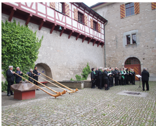
Alphornbläser und Chor an der GV 2018 im Schlosshof.

Übrigens: als Vorprogramm der letztjährigen Generalversammlung des Vereins traten die Tösstaler Alphornbläser und die Chorvereinigung Weisslingen/Kyburg mit Frühlingsmelodien «Stägeli uf, Stägeli ab» in verschiedenen Räumen auf. Das eigens fürs Schloss