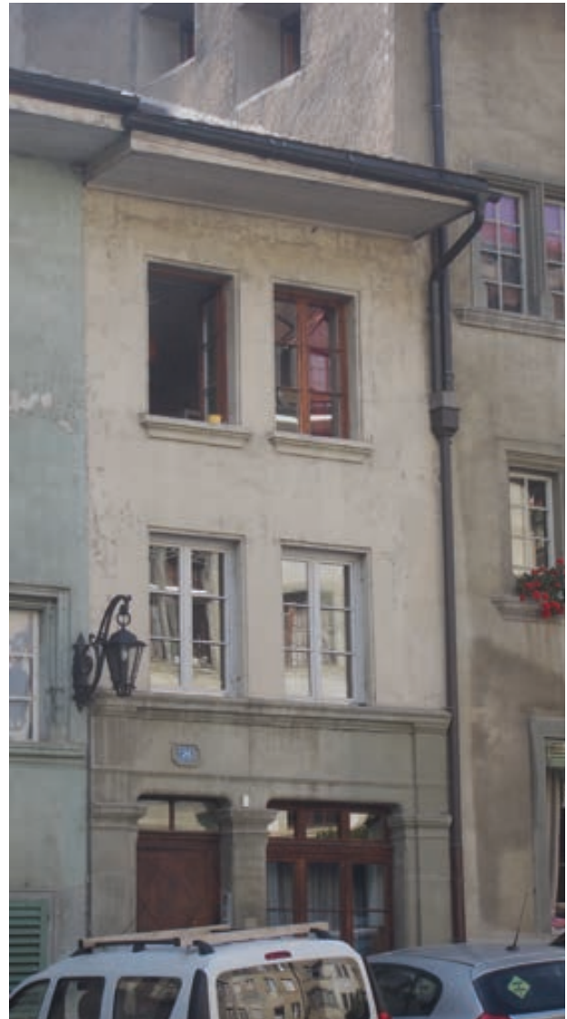
Einstiges Beginnenhaus in der heutigen Unterstadt.