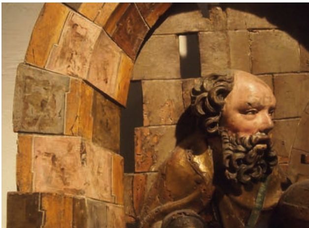
Farbenreiche Holzplastik: Anbetung der Könige, 1520-1525.

Kantone die Objekte, auch keine bürgerlichen Revolutionen fanden im 19. Jahrhundert statt, von Kriegen blieb Freiburg weitgehend verschont. Folglich war Freiburg aber auch über Jahrhunderte sehr konservativ, wenig industrialisiert. Die reichen, vornehmen Familien verdienten ihr Geld vornehmlich im Solddienst, was ihnen auch Zugang zu den europäischen Fürstentümern und deren Kultur verschaffte – und auch zu herrschaftlichem Mobiliar, wie im Museum gezeigt.