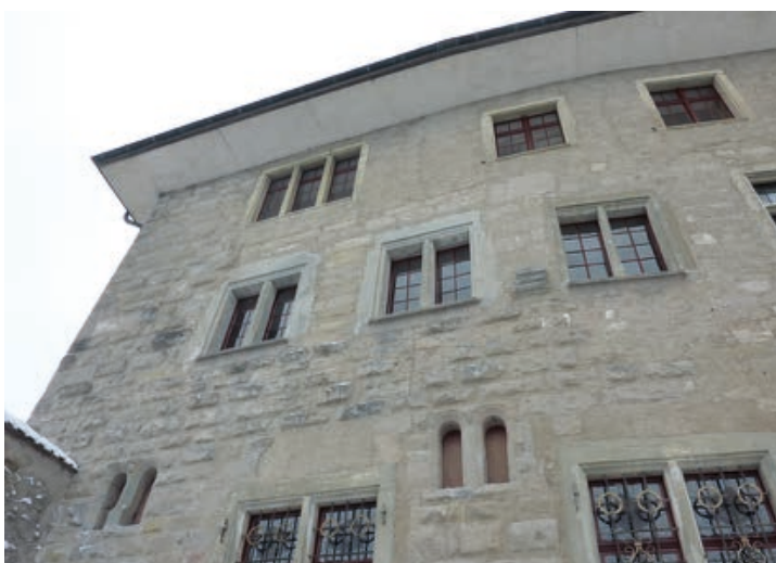
Die Nordostfassade des Grafenhaus.

die wieder in ockere und graue Quader unterteilt werden können. Diese neu gebaute Mauer hat ein steinernes Obergeschoss, spätestens kurz vor dieser Reparatur wurde es also auf den Saalbau aufgesetzt. Im Erdgeschoss hingegen weist diese Mauer keinerlei Fenster auf. Das spricht dafür, dass der Saal aufgegeben wurde. Vermutlich hat die unbekannte Zerstörung sein repräsentatives Interieur vernichtet. Wahrscheinlich hat zu diesem Zeit-