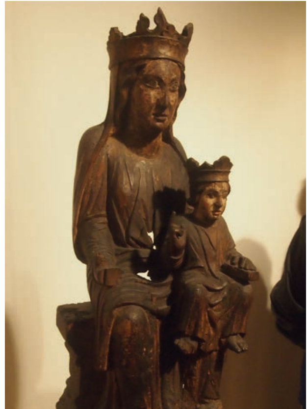
Madonna mit Kind aus dem 13. Jahrhundert .