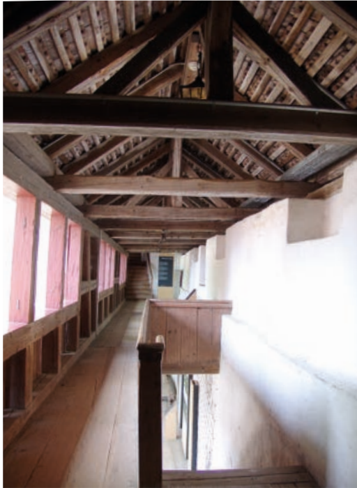
Der Westliche Wehgang.

abgebrochen worden sein, worauf auch die bei der Grabung von 1998 gefundenen Fundamente dieses Bauwerks hinweisen. Interessanterweise gibt die Nordwand des Ritterhauses einen Hinweis auf das genaue Datum. In dem Bereich in dem sich der Schopfen den ergrabenen Fundamenten zufolge an das Ritterhaus angelehnt hat, befinden sich keine der ansonsten zahlreichen Spuren von mittelalterlichen Fenstern im Erdgeschoss und im 1. Obergeschoss. Die älteste Öffnung ist ein Fenster von 1786/87, dazu kommen Türen aus dem frühen 19. und 20. Jahrhundert. Mit dem Bau des Schopfes ist also schon im 14. Jahrhundert zu rechnen, mit seinem Abbruch 1786. Mit der Errichtung der Wehganglaube und des Wehanges wurde die Ringmauer um einen knappen Meter abgetragen. Die Abbruchspuren an der Aussenwand des Ritterhauses