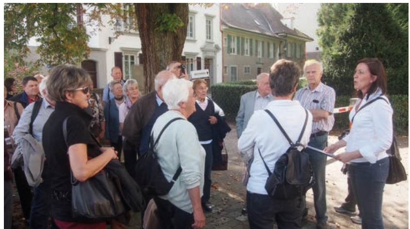
Beim Jesuitenkolleg über der Stadt.

Am zweiten Standort, wo sich der Blick über die Neustadt weitete, wies die Führerin auf das heutige Puff hin in der Brunnengasse. Da das Gesetz genau vorschreibe, wie weit weg ein derartiges