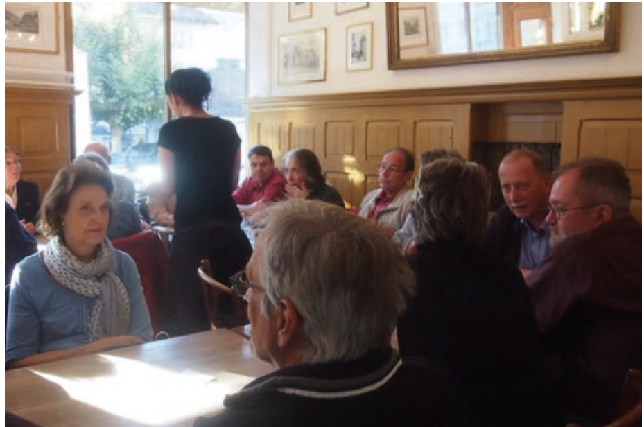
Start mit café et croissant im Café des Arcades.