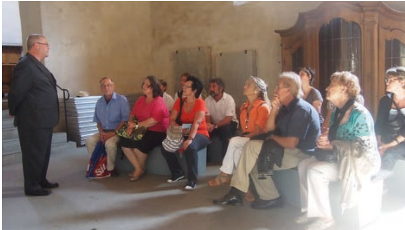
MitarbeiterInnenausflug auf die Insel Reichenau, Führung in der Klosterkirche.

zufälliges Laufpublikum teil. An den Gartenführungen und den historischen Einführungen zu den Jahreszeitenkonzerten des Sarastro Quartetts scheint sich unter den Teilnehmenden vermehrt ein Stammpublikum einzufinden. Der internationale Museumstag Mitte Mai umfasste dieses Jahr das weitgreifende Thema «Welt im Wandel – Museen im Wandel», für Museumsleiter Ueli Stauffacher Anlass, eine Sonderführung zum Schloss Kyburg als Ausstellungsort und Museum anzubieten: «Das Museum in der Kyburg: früher, heute, morgen». Im September, am Tag des Denkmals mit dem Motto «Stein und Beton», wurde das Programm mit der städtischen Denkmalpflege Winterthur koordiniert. Ueli Stauffacher führte eine Wanderung von Sennhof nach Kyburg. Der Titel «Butter, Käsli und Fleisch für die Kyburg» deutete schon die Stationen an, die ehemaligen Höfe Häsental und Linsental mit kurzem Halt beim Turbinenhaus der Spinnerei und weiter an der Töss entlang über den alten Reitweg hinauf zur Burg.