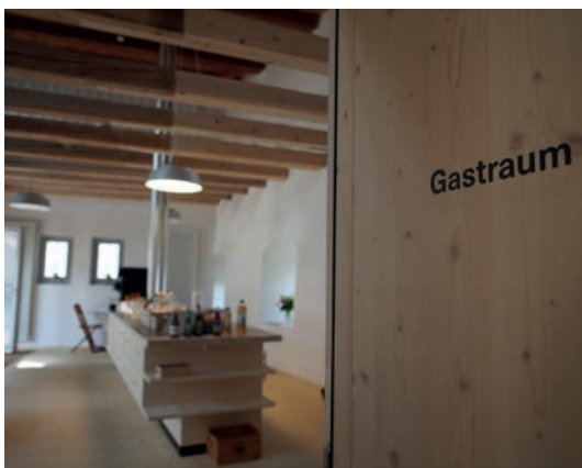
Hell und einladend: der neue Gastraum.