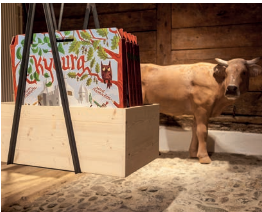
Eine Kuh in historischer Originalgrösse im ehemaligen Kuhstall im Ökonomiegebäude.