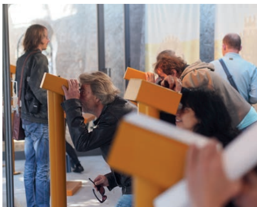
Auf MitarbeiterInnen-Ausflug im Museum Burg Zug.