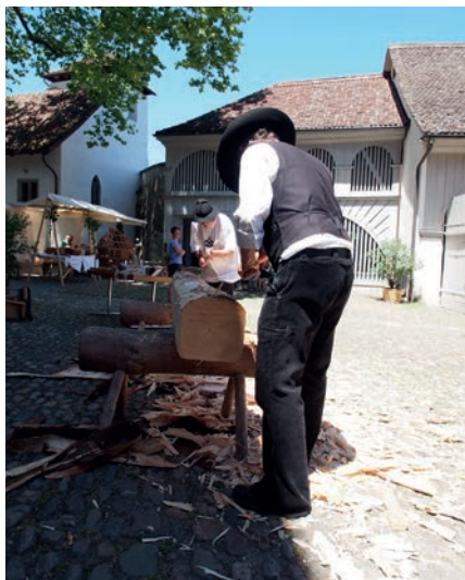
Baunahndwerk live: Zimmerleute behauen mit Beilen einen Balken.

Einen Tag darauf, am Sonntag 18. Juni, waren dann am Tag der offenen Tür alle BesucherInnen eingeladen, die neue Ausstellung zu besichtigen. An den Ständen gab es Verpflegung, im Gastraum Getränke zu kaufen. Das Begleitprogramm bot Führungen und Handwerk (Steinmetzin, Zimmerleute) sowie mittelalterliche Musik von «Schellmery».