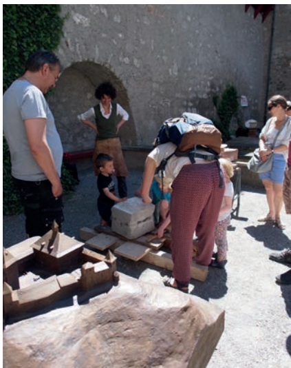
Unter Anleitung der Steinmetzin behaut das Publikum Sandsteine.