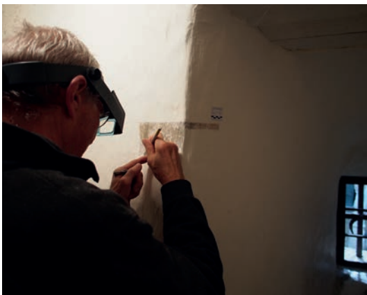
Freilegung der Grisailen im Archiv im Frühling 2017.