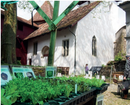
Setzlingsmarkt, 2016 im Schlosshof.