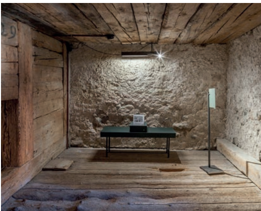
Das Blockgefängnis im Turm ist neu zugänglich.