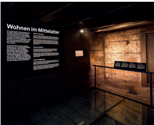
Die «Schwarze Stube» im Forum für Schweizer Geschichte.