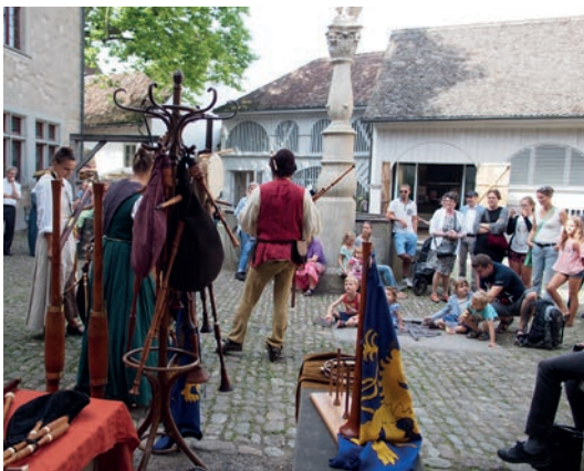
Hoeboeken Dans spielte auf am Grossen Brauch für alle.