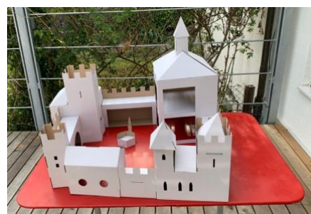
...entsteht die Kyburg!